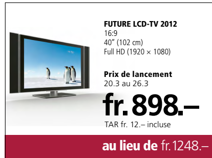
Illustration de l'exemple de prix de lancement

Le magasin Hi-Fi veut faire connaître à sa clientèle le nouveau téléviseur Future LCD-TV 2012 complétant l'assortiment. A des fins publicitaires, il propose ce produit à un tarif plus avantageux pendant une durée limitée. Dès le 20 mars et pour une semaine, les prix affichés dans le magasin sont les suivants : «Prix de lancement fr. 898.– au lieu de fr. 1248.–». Il fait paraître simultanément l'annonce suivante →