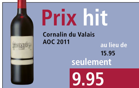
Illustration de l'exemple d'autocomparaison (variante 1)

Le magasin Hell a vendu la bouteille de 75 cl de vin rouge du Valais Cornalin 2011 du 3 avril au 28 mai, soit pendant 8 semaines, au prix de fr. 15.95. A partir du 29 mai, le magasin baisse le prix de la bouteille à fr. 9.95. L'indication de prix dans le magasin pendant 4 semaines, soit du 29 mai au 25 juin est la suivante : «seulement fr. 9.95 au lieu de fr. 15.95». Simultanément est publiée l'annonce suivante →